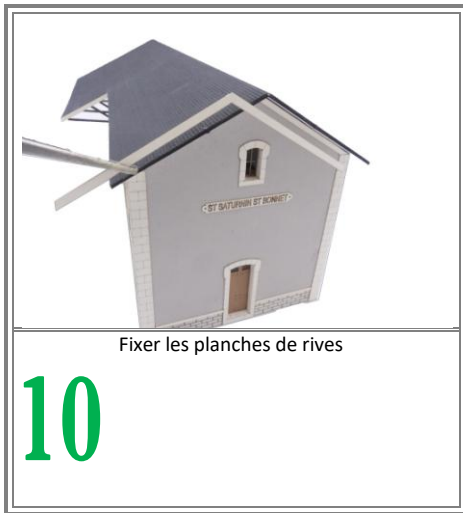
Fixer les planches de rives