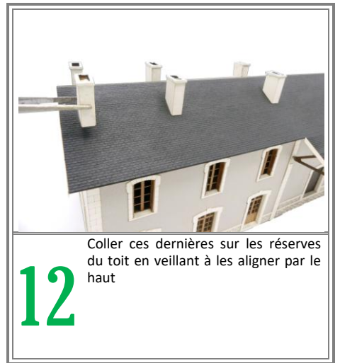
Coller ces dernières sur les réserves du toit en veillant à les aligner par le haut