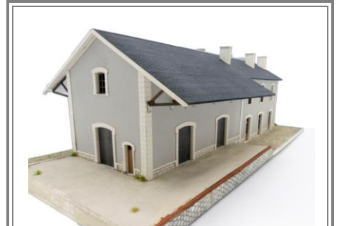
Votre bâtiment est terminé, vous pouvez le patiner selon vos go