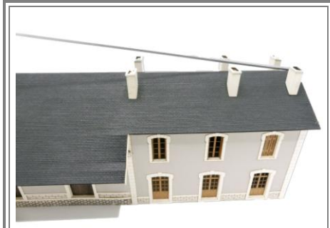
Enfin, coller la faîtière, pour un assemblage plus aisé, il est conseillé de repasser la pliure avec un cutter fin genre X-acto ou scalpel.