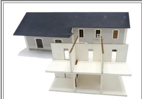
Confectionner le cloisonnement interne, vous pouvez le décorer à l'aide des textures disponible sur notre site, rubrique : "Vidéos&Goodies"