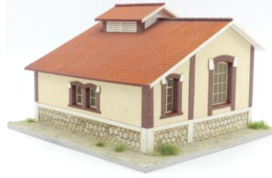
Poser les planches de rives