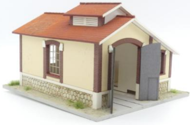
Mettre en place les cheminées